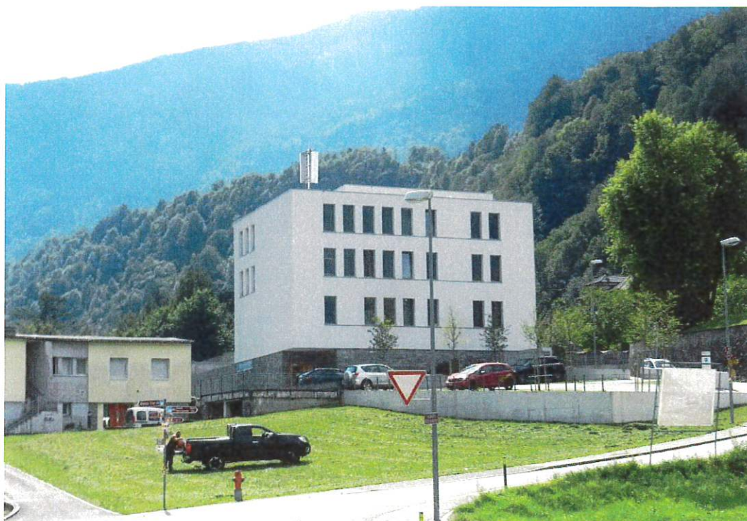
Rendering nuova antenna, vista da nord