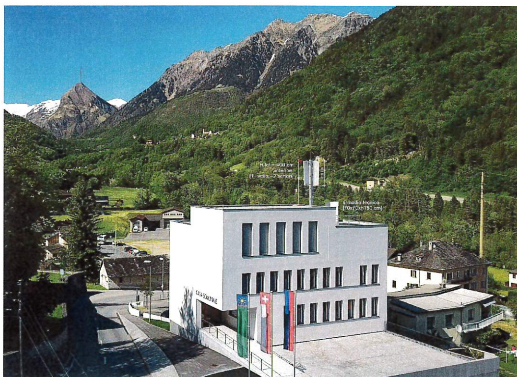
Rendering nuova antenna, vista da sud